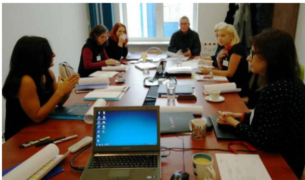
I Partner durante il kick-off meeting.